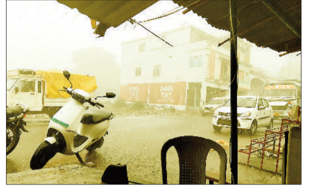
हुई बारिश, तापमान में आई गिरावट।

सोनहत खंड स्तर पर 15 मई की दोपहर लगभग 12:30 बजे मौसम अचानक बदलने से आंधी के साथ काफी देर तक तेज बारिश होती रही। हालात रही कि मुख्यालय से जाने वाले विभिन्न यात्री बस बारिश न झेल पाने से बस स्टैंड में खड़े रहे। सुबह कड़कड़ाती धूप 12 बजे तक रहने से आमजन रोजमर्रा के कामकाज निपटाने व्यस्त रहे, तभी अचानक हवा तूफान आने के साथ बारिश का माहौल बनते ही जोरदार बारिश काफी देर तक हुई, इससे आमजन खासे हलाकान रहे। आए दिन दोपहर बाद बारिश गर्मी के मौसम में होने से मौसम जरूर कूल-कूल हो रहा, परंतु मौसमी बीमारी का असर भी घर करता नजर आने लगा है।