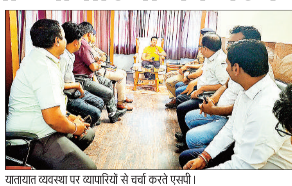
यातायात व्यवस्था पर व्यापारियों से चर्चा करते एसपी।

हरिभूमि न्यूज ▶▶ पथलगाव शहरी क्षेत्र में लगातार बढ़ते यातायात के दबाव को देखते हुए पुलिस अधीक्षक शशिमोहन सिंह ने स्थानीय व्यापारी एवं चेंबर ऑफ कॉमर्स के सदस्यों के साथ बैठक में शहर की यातायात व्यवस्था के संबंध में चर्चा की। 15 मई को एसपी एक बार फिर बैठक लेंगे।