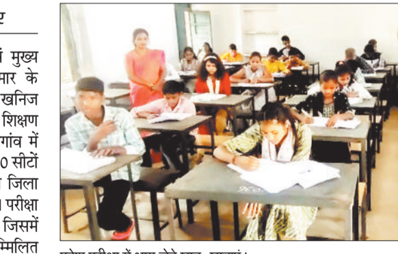
प्रवेश परीक्षा में भाग लेते छात्र-छात्राएं।