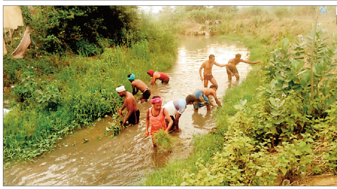
अपने खेतों तक पानी पहुंचाने नहर की सफाई करते किसान।

जिले के सबसे बड़े धान उत्पादन के नाम से मराहूर कोतबा क्षेत्र के किसान को खमगड़ा जलाशय परियोजना के विस्तार नहीं होने के कारण परिपक्व हो चुके धान की फसल के लिये चार किलोमीटर की सफाई कर अपने खेतों में पानी पहुंचाना पड़ा।