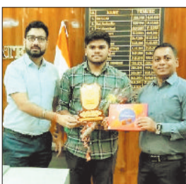
कलेक्टर से मुलाकात करते छात्र।

बैकुण्ठपुर। छत्र माध्यमिक शिक्षा मंडल ने दसवीं एवं बारहवीं की बोर्ड परीक्षा के वतीज विगत दिनों घोषित की गई थी।