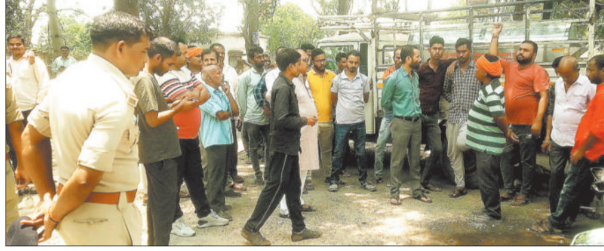
थाने के बाहर हंगामा करते परिजन।