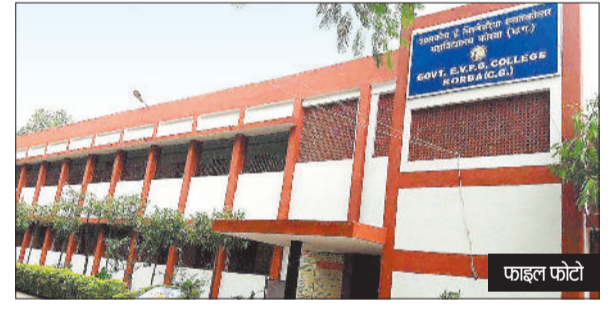
शहर में एक और कॉलेज की दरकार

हरिभूमि न्यूज ▶▶ कोरबा महाविद्यालय में प्रवेश की प्रक्रिया 15 जून से शुरू होगी, किंतु सीजी रिजल्ट घोषित होने के बाद महाविद्यालयों में प्रवेश को लेकर एक बार फिर मारा-मारी मचने की स्थिति निर्मित होगी। बीते चार वर्ष से अटल बिहारी वाजपेयी विश्वविद्यालय प्रबंधन द्वारा स्नातक स्तर में सीटों की संख्या को नहीं बढ़ाने के कारण अब फिर से बीते वर्ष जैसी स्थिति निर्मित होगी। हायर सेकेंडरी में उत्तीर्ण होने वाले छात्रों की संख्या बीते वर्ष से अधिक है।